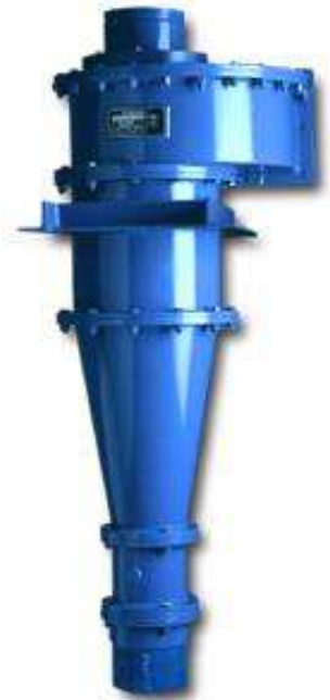
Hydrocyklony Krebs dostępne są w niespotykanej szerokiej gamie wymiarów i konfiguracji dzięki czemu są wykorzystywane w wielu procesach technologicznych.