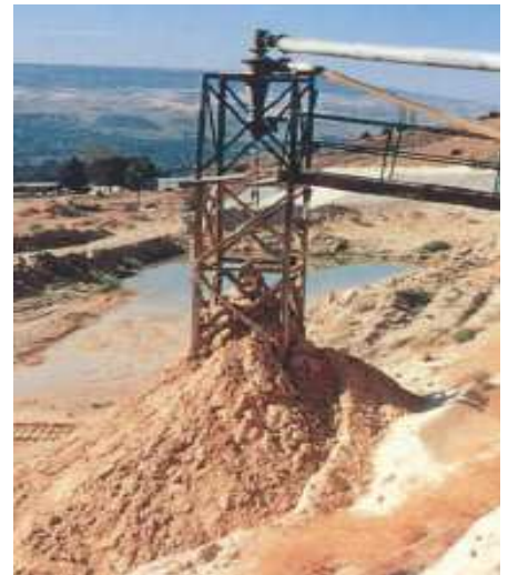
Hydrocyklony odwadniające z przystawką CycloStack™ mogą być montowane na wieżach i estakadach lub nad przenośnikami.

Hydrocyklony Krebs oferują wysoko wydajny, o niskich kosztach sposób przerobu wszystkich rodzajów piasków i żwirów. Hydrocyklony Krebs są kompaktowe, nie mają żadnych części ruchomych a ich koszty zakupu, działania i obsługi są niewielkie. Cechują się wysoką wydajnością i dużą efektywnością separacji. Wymagają jedynie minimum uwagi operatora a zajmują przy tym jedynie ułamek powierzchni porównywalnych zbiorników osadników grawitacyjnych. Dzięki konstrukcji modułowej oraz możliwości wymiany wykładzin wewnętrznych w miejscu montażu wydłuża się żywotność urządzenia, zmniejsza koszty obsługi oraz minimalizuje przestoje węgla technologicznego.